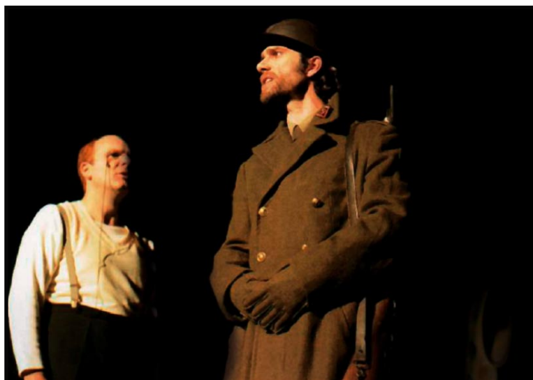
> Dreyfus tente de tenir tête au gardien...

Mais cet acteur au physique de jeune premier au regard ténébreux excelle dans des rôles dramatiques comme le frère dans Roberto Zucco de B-M Koltès (2001) et le gardien dans Dreyfus et le cul-de-jatte Bernard de J-J Vergnaud (2002) joués au sein de la compagnie Ilot-Théâtre, dans des mises en scène de S. Irlinger et L. Huselstein et dans Mais où vole-t-elle d'après Grimm et E. Poe (2005-2006) où il joue le rôle d'un préfet dans une mise en scène de M. Fontanille (compagnie Haute Tension à La Rochelle).